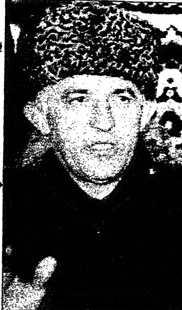
اسلان مسخادوف أحد المرشحين للرئاسة في الشيشان خلال اجتماع صحافي عقدته أمس في غروزني (روسيا)

للقول مسكون محفوفة بالخطار بالنسبة للمسحادوف، إذ أن العديد من المرشحين الآخرين ومن بينهم الرئيس الحالي سليم خان ياديريف، والزعيم العسكري أحمد زكاييف، أبدوا نيتهما في دعم ياسينيف.